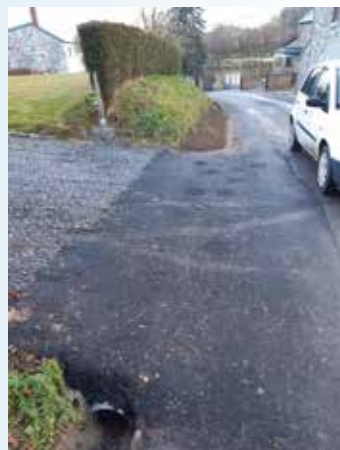
Travaux pour l'évacuation d'eau