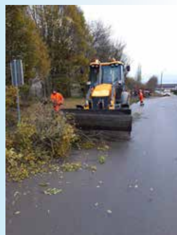
Elagage à Bois-et-Borsu