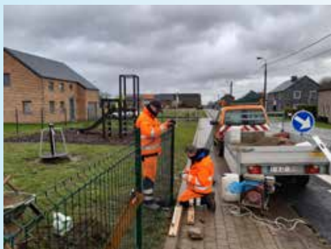
Mise en place d'une clôture à la plaine de jeux d'Atrin