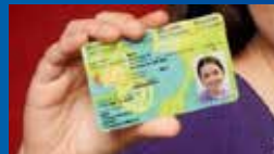
Photo d'identité et présence obligatoire de l'enfant et d'une des deux parents lors de la demande de la carte.