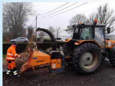
Opération d'élagage au service de la population.