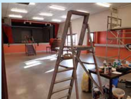
Nouvelle peinture pour la salle Le Repair