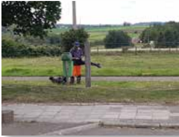
Vidange des poubelles

Certaines tâches sont régulières (vidange des 84 poubelles publiques ; arrosage des bacs et des nouvelles plantations, tonte et taille dans les espaces verts, réparations de voirie, nettoyage, etc... ) ; d'autres, plus « exceptionnelles » (rénovation du plafond à la salle de Pailhe, création d'une « placette de repos » à Bois-et-Borsu, réparation à la chapelle de la rue Haya à Ocquier,...).