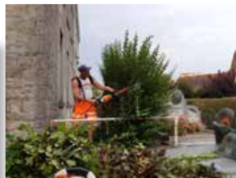
Entretien des accotements et des espaces verts