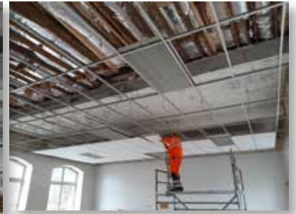
Salle de Pailhe