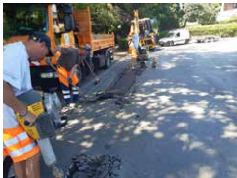
Réparation de voiries