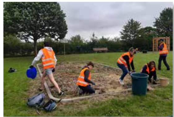
Les jeunes d'été solidaire au travail

Certaines valorisantes (encadrement des équipes "été solidaire", embellissement) et d'autres bien plus ingrates... (ramassage et gestion des déchets sauvages !!!)