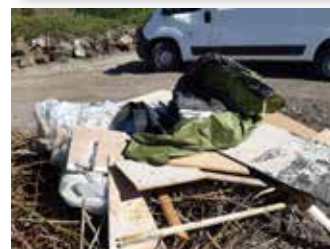
La gestion des dépôts sauvages reste malheureusement trop régulière !