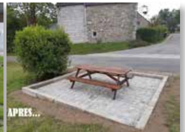
Bouresse à Bois-et-Borsu

Certaines valorisantes (encadrement des équipes "été solidaire", embellissement) et d'autres bien plus ingrates... (ramassage et gestion des déchets sauvages !!!)