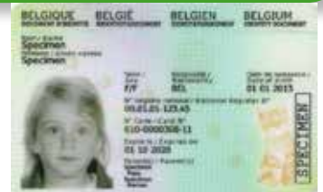
Photo d'identité et présence obligatoire de l'enfant et d'un des parents lors de la demande de la carte.