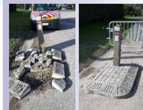
Réparation des ilots de sécurité à Ochain

Travaux d'aménagement de la rue du Vicinal : création de trottoirs, création de nouvelles conduites et raccordement pour la Ciesac, nouveau revêtement. Travaux conjoints avec la Ciesac pour un montant de 220.000 €, dont 8.500 € pour la Ciesac et 135.000 € de subside.