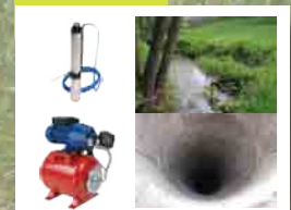
Pompe immergée ou groupe hydrophore