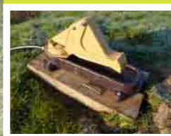
Pompe à museau