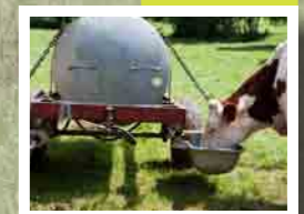
Tonne à eau