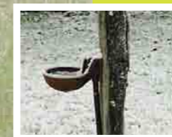
Eau de conduite